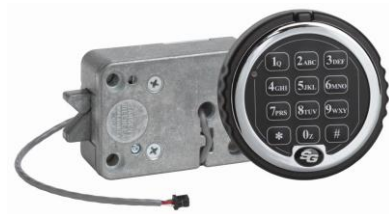
CERRADURA ELECTRÓNICA Z03