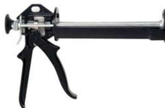
Pistola BRIK-CEN P-1444