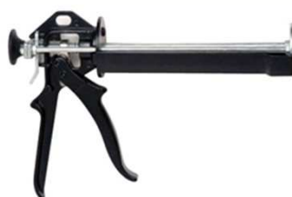
Pistola BRIK-CEN P-1444