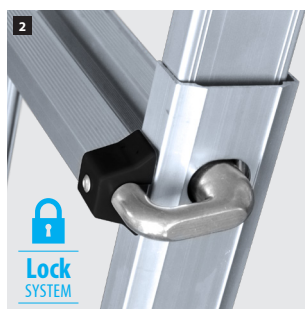
2 Sistema telescópico de posicionamiento. Telescopic positioning system. Système télescopique de positionnement. Sistema telescópico de posicionamento.