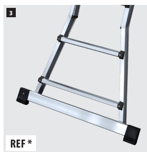
3 Base estabilizadora para uso como escalera de apoyo. Stabilizer base to be used as a leaning ladder. Base stabilisatrice pour utilisation comme échelle de support. Base estabilizadora para uso como escada de apoio.