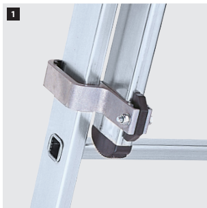
1 Sistema de deslizamiento de aluminio. Aluminum sliding system. Système de glissage en aluminium. Sistema deslizante de alumínio.

✂ Productos suministrados parcialmente desmontados. Products supplied partially disassembled. Produits fournis partiellement démontés. Produtos fornecidos parcialmente desmontados.