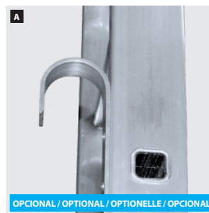
3 Bloqueo de seguridad. Safety lock. Blocage de sécurité. Trava de segurança.